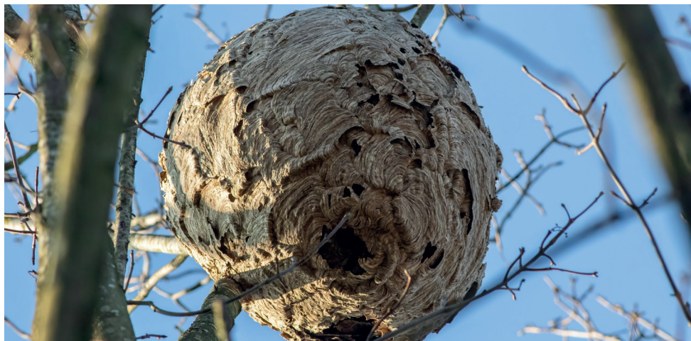
Nid secondaire de frelon asiatique

La destruction des nids représente un moyen de lutte essentiel contre le frelon asiatique, il convient donc d'observer attentivement les déplacements pour détecter un nid.