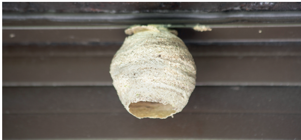
Nid primaire de frelon asiatique en construction